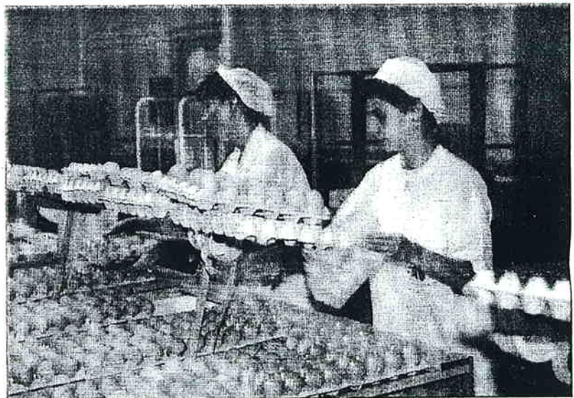
Diferentes laboratorios analizan si en los huevos de Cantos Blancos hay residuos de medicamentos cuya utilización está prohibida desde 1997 por la Unión Europea. PEPE ZAMORA