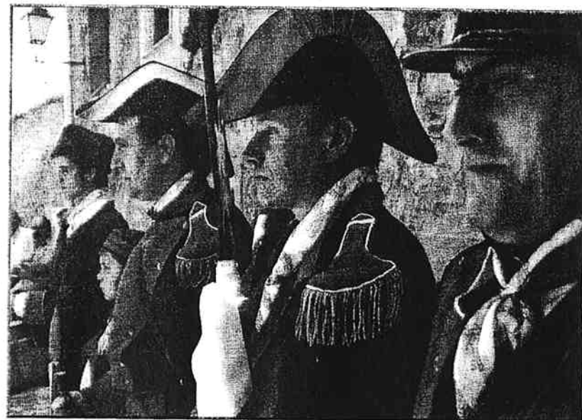
Nadie sabe con exactitud cuando nace esta tradición que sigue viva gracias al tesón de los vecinos de Codes.